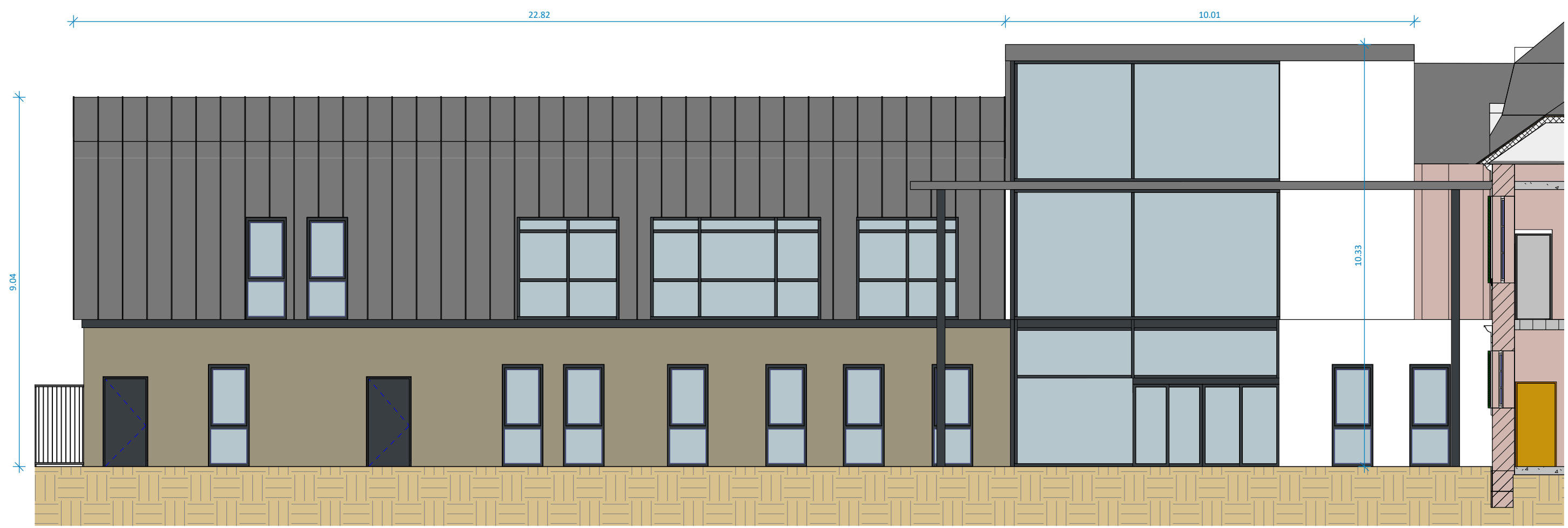
Façade nord-est Ech. 1 : 100