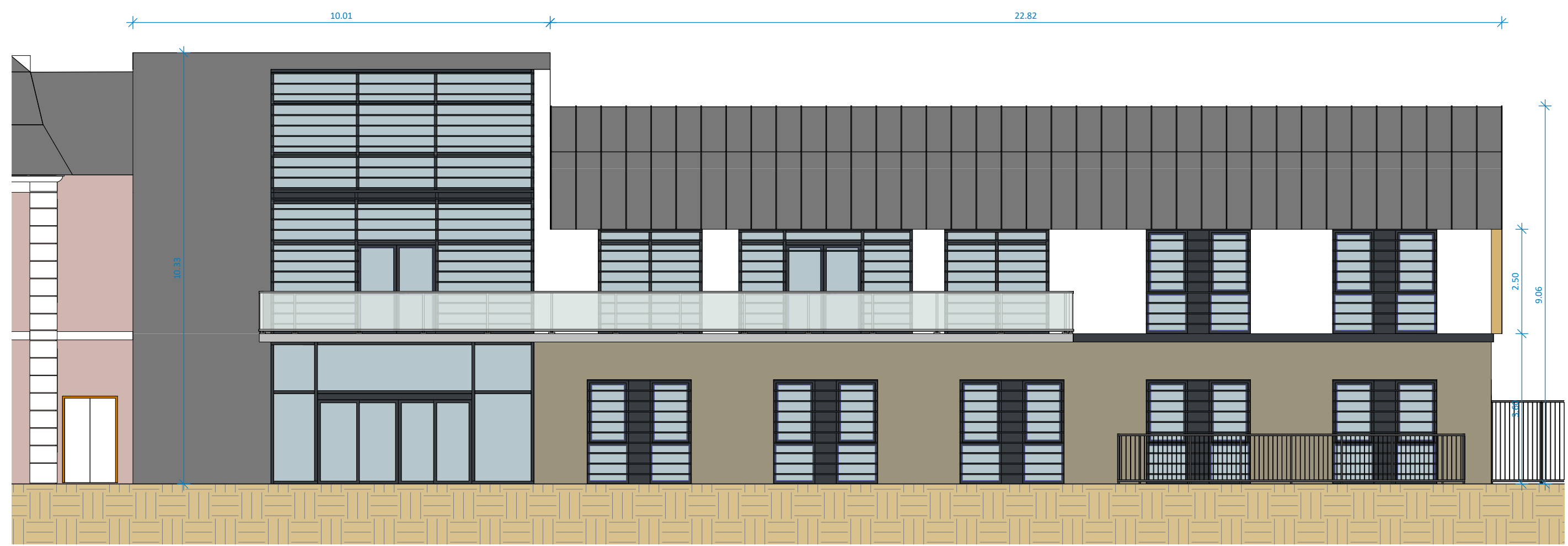
Façade sud-ouest Ech. 1 : 100